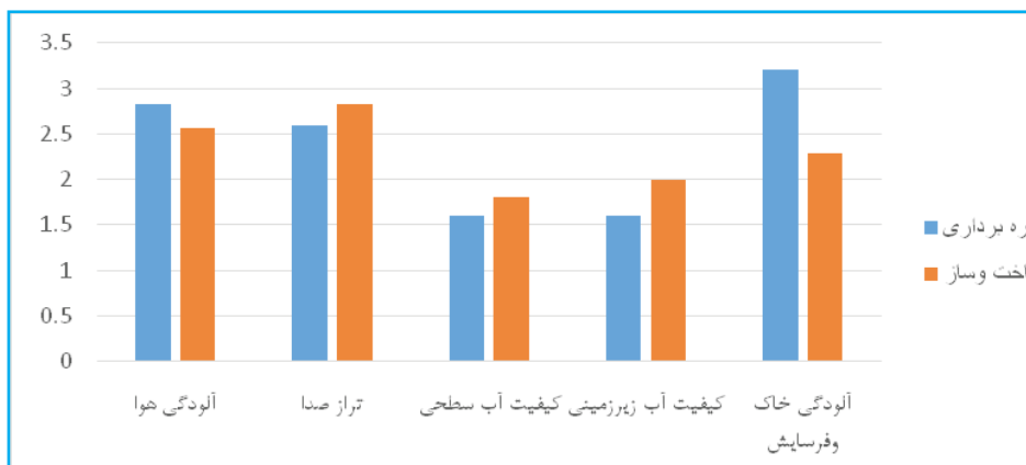
نمودار ۲. میانگین آثار منفی در بخش فیزیکی