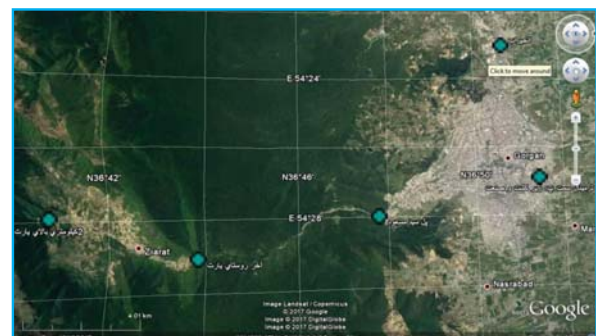
شکل ۱. موقعیت جغرافیایی ایستگاه‌های نمونه‌برداری

داده‌های به‌دست آمده وارد نرم‌افزار آنالیز NSFQI شده و شاخص‌ها محاسبه گردید (جدول ۲ و ۳). نتایج به‌دست آمده با توجه به شاخص‌های پراکنندگی مرکزی آنالیز شده و با توجه به نتایج به‌دست آمده به سؤالات تحقیق پاسخ داده شد.