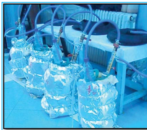
شکل ۱. تصویری از پایلوت ساخته شده

ورود نمونه با یک منفذ جهت نصب دماسنج، یک شیر کنترل برای خروج گاز تولیدی تعبیه و پس از آن یک عدد سهراهی که ابتدا به تیوپ جمع‌آوری گاز و سپس به شیر نمونه‌برداری گاز متصل گردید. تمام اتصالات با نوار تفلون و چسب آکواریم کاملاً آب‌بندی و جهت کنترل آب‌بندی و عدم نشت هوا به داخل مخازن، مخازن پر از آب شدند. سپس مخلوط‌ها داخل مخازن طراحی شده ریخته و در مخزن (که اتصالات مشروح روی آن نصب شده بود) بسته شد. بعد از این مرحله جهت جلوگیری از تبادل حرارتی مخلوط داخل مخازن و محیط اطراف، مخازن با پشم شیشه عایق‌بندی شدند. در ابتدا قبل از بستن در مخازن پایلوت، از مخلوط اولیه هر یک از مخازن نمونه اولیه برداشت شد و آزمایشات COD، pH و TKN در شیرابه و هر یک از مخلوط‌های مورد بحث اندازه‌گیری شدند. بعد از ۲ ماه (پس از انجام فرآیند و تولید گاز) تمام آزمون‌های ابتدای کار بر روی مخلوط نهایی هر یک از مخازن، به منظور تشخیص راندمان تصفیه شیرابه زباله در این روش، انجام شد. تمام آزمایشات طبق روش کتاب استاندارد متد انجام شد (۸).